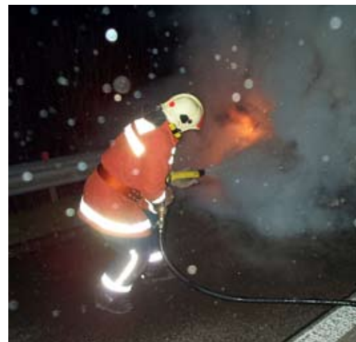
Die Goldacher Feuerwehr stellt zusammen mit dem Zug Untereggen den Feuerschutz sicher.

Die Technischen Betriebe Goldach beliefern die Dörfer Goldach und Untereggen mit Strom, Wasser und Gas. Sie können sich in der gesamten Gemeinde auf ein gut ausgebautes Werkleitungsnetz abstützen.