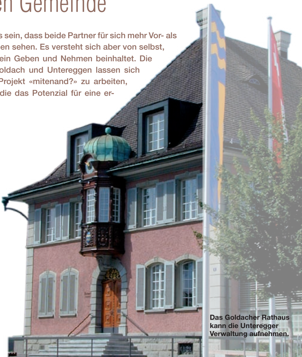
Das Goldacher Rathaus kann die Unteregger Verwaltung aufnehmen.